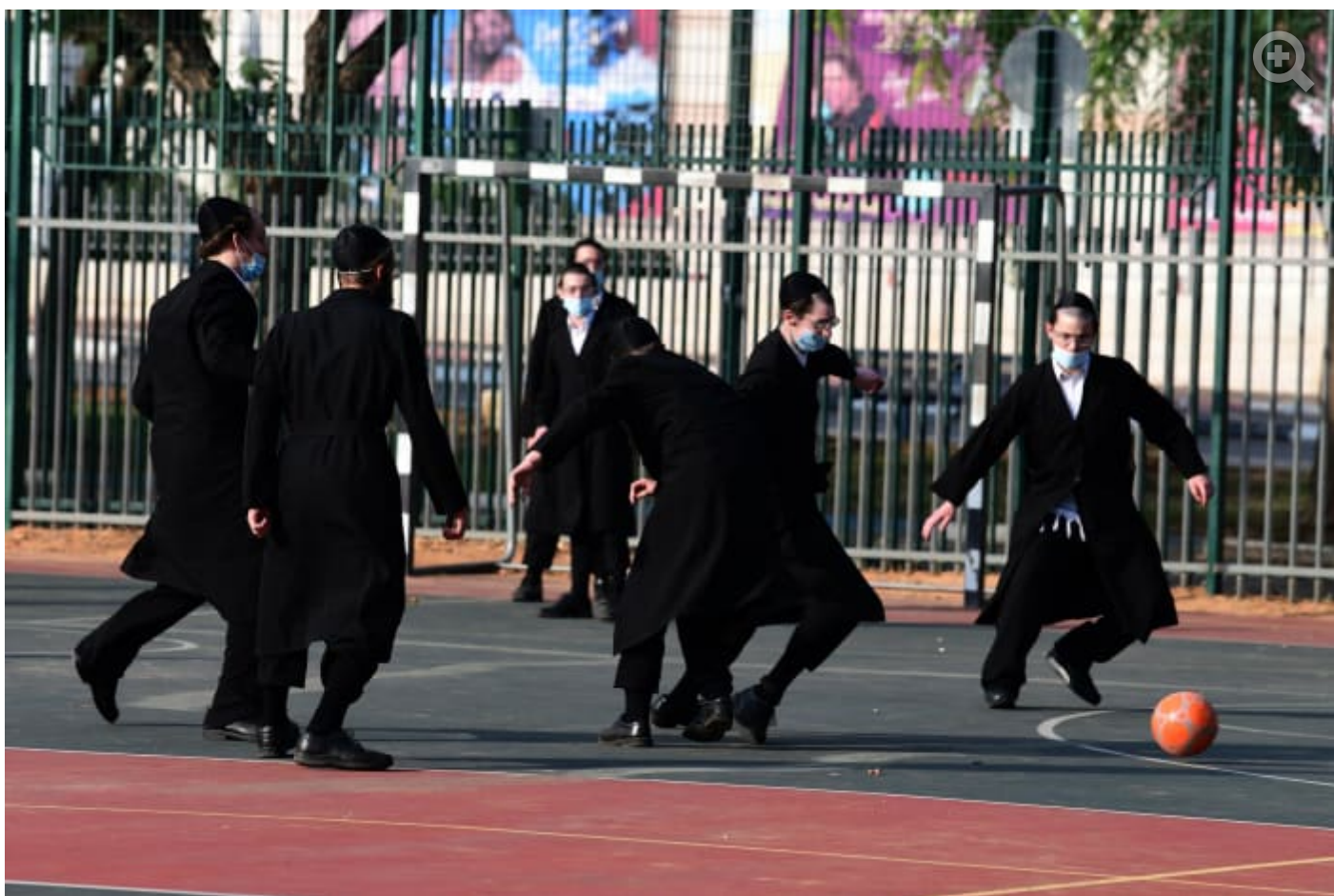
רבים משקיעים זמן ומאמץ בהכשרה מקצועית, רק כדי לגלות שאין להם את הכלים הדרושים (למצולמים אין קשר לכתבה. צילום: ראובן קסטרו)

הפער שנוצר בין ציפיות המעסיקים לבין מה שרבים מהגברים החרדים יכולים להציע הופך לחסם משמעותי בדרך להשתלבותם מחדש במשרות איכותיות פוסט-קורונה. הדבר גם מוביל לתסכול בקרב רבים מהצעירים החרדים, המשקיעים זמן ומאמץ בהכשרה מקצועית רק כדי לגלות כי עדיין אין להם את הכלים הדרושים, וכי הם נדחים שוב ושוב על-ידי מעסיקים.